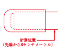
<ちくとうの最小直径値の計測方法>