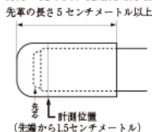
<竹刀の先革長、先端部最小直径値の計測方法>